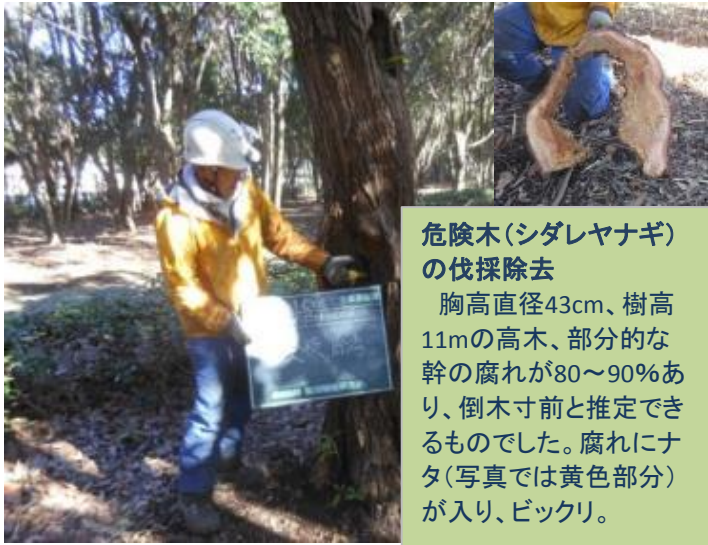
危険木(シダレヤナギ)の伐採除去 胸高直径43cm、樹高11mの高木、部分的な幹の腐れが80~90%あり、倒木寸前と推定できるものでした。腐れにナタ(写真では黄色部分)が入り、ビックリ。

公園指定管理者の自主的な企画で、安心・安全な森づくりの専門家による特別な樹林地管理です。内容は倒木や落枝等による危険性を減らすものや防犯のためのもので、場所はタワー広場から駐車場、さらに美術館までと園路灯付近です。より快適で安心な利用が望めように努めました。なお、園内の倒木や落枝による危険をすべて取り除けた訳ではありません。園内をご利用いただく場合には安全対策も必要です。