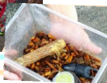
ヘラクレス オオカブト

7月15日(日)開催のみどりの学校は、「カブトムシの生態」について学びました。専門家の方を講師に招いて、およそ90分間の講義となりました。