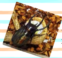
アトラス オオカブト